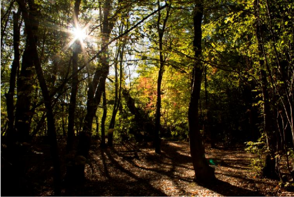
عکس پنجم: نمایی از جنگل‌های زیبای گرگان در مسیر روستای زیارت