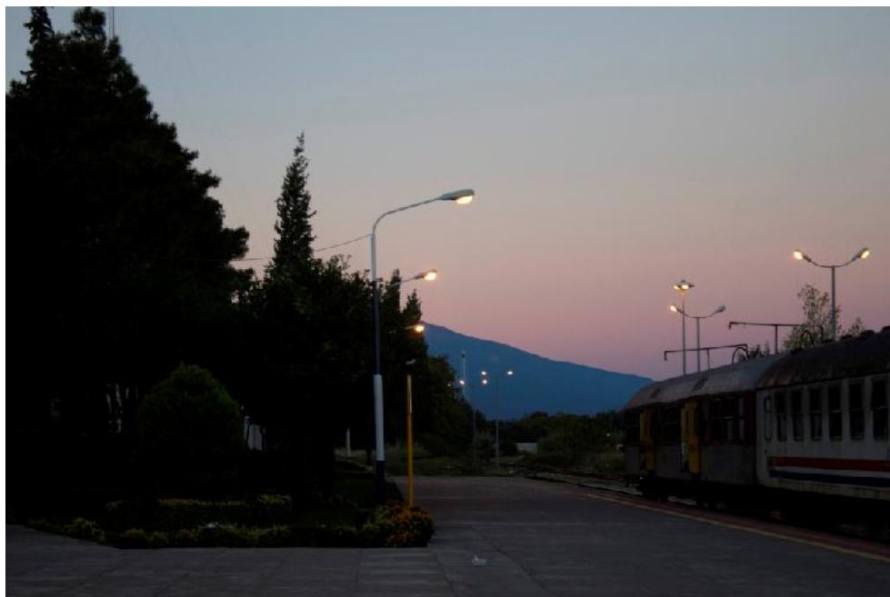
عکس چهارم: ایستگاه قطار گرگان، صبح زود