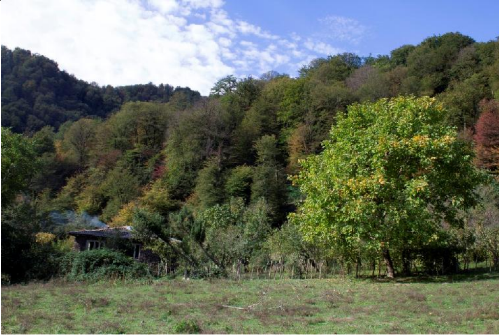
عکس هفتم: کلبه‌ای آرام در دل جنگل‌های ناهارخوران