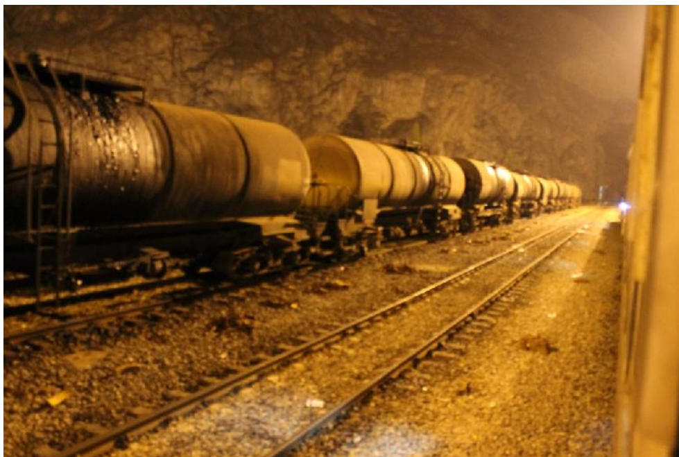
عکس سوم: ایستگاه قطار فیروزکوه، شب اول در قطار

عکس دوم: موقعیت جغرافیای منطقه ناهارخوران در نقشه ایران