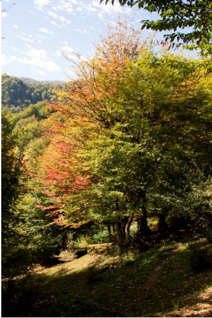
عکس نهم: جنگل های رنگارنگ ناهارخوران